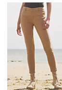
SOL'S JULES WOMEN 01425