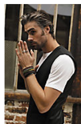
NEOBLU MAX MEN 03166