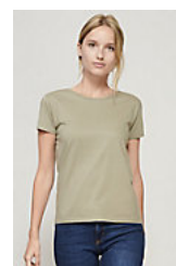
SOL'S PIONEER WOMEN 03579