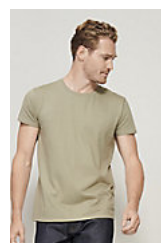
SOL'S PIONEER MEN 03565