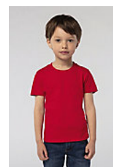
SOL'S PIONEER KIDS 03578