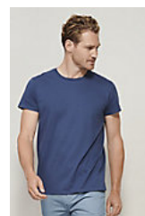
SOL'S CRUSADER MEN 03582