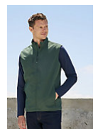
SOL'S FALCON BW MEN 03825