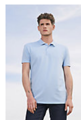
SOL'S SUMMER II 11342