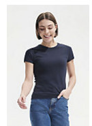
SOL'S MISS 11386