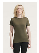
SOL'S REGENT WOMEN 01825