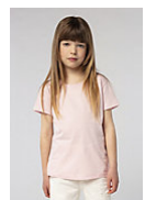
SOL'S CHERRY 11981