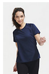
SOL'S SPORTY WOMEN 01159