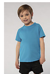
SOL'S SPORTY KIDS 01166