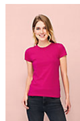
SOL'S MISS 11386